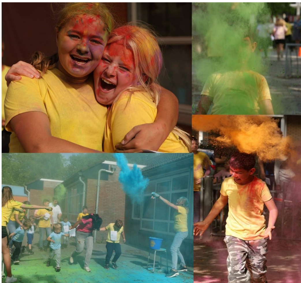
Sfeerimpressie Colour Run september 2023

Leerlingen kunnen via projecten van school meedoen aan goede doelen. In het verleden is een kindertehuis in India gesponsord en hebben we meegedaan aan de acties van Edukans. Jaarlijks kiest het team in overleg met de medezeggenschapsraad een goede bestemming. De opzet is dat het mes aan twee kanten snijdt. Enerzijds om daadwerkelijk steun te geven aan een derdewereld project. Anderzijds de opvoeding van de kinderen: je bent niet alleen op de wereld en je kunt wat doen voor hen die er zoveel slechter aan toe zijn dan jij.